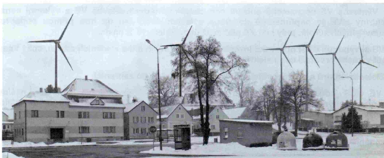
VTE Krásné Údolí – vizualizace pohledu z náměstí v Krásném Údolí.